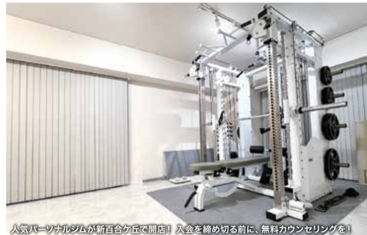
人気パーソナルジムが新百合ヶ丘で開店! 入会を締め切る前に、無料カウンセリングを!

Deep Training Studio 新百合ヶ丘 稲城市平尾1-54-20 長財ビル203 ☎042-610-2255 ✉info@yuragi-physical.com 🕒9:00~20:00 📅日曜 📍6台 https://yuragi-physical.com/