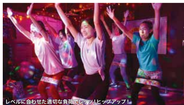
レベルに合わせた適切な負荷でレッツ!ヒップアップ!

ヒップアップに特化したフィットネスジム 「ココロもお尻も上向きに」がコンセプト。楽しくヒップアップやダイエットをして、ボディラインを作りたい人におすすめ! グループレッスンを体験後に入会を決められるため安心。全身各部位のトレーニングや、丁寧な食事指導があるのも魅力。