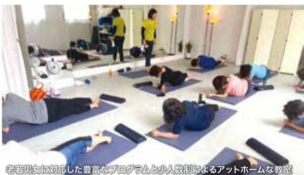
老若男女に対応した豊富なプログラムと少人数制によるアットホームな教室

さあ、動こう! 駅近くで一緒にシェイプアップ! 駅から徒歩2分、通いやすい隠れ家スタジオ。ヨガ・ピラティス・フラダンス・キッズダンス・バレエ・トレーニングなど、幅広いプログラムがそろそろ。丁寧なサポートで、初めての人や運動が苦手な人も安心して参加できる。無料体験受付中。