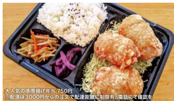
大人気の依唐揚げ弁当 750円 ※配達3000円からの注文で配達距離に制限有、電話にて確認を