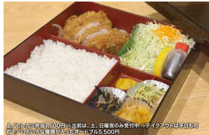
上/ヒレカツ弁当1,500円 ※出前は、土、日曜夜のみ受付中 ※テイクアウトは平日も可 右下/いろいろな種類が入ったオードブル5,500円

麻生区上麻生5-44-24 (柿生駅南口より徒歩2分) ☎044-572-1136 🕒9:00~20:00 (土曜9:00~18:00) 📌日曜・祝日、第2水曜 📌近隣に有料P有