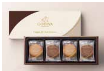
参加者にはお土産として人気ブランド「ゴディバ」のクッキーセットを進呈

セミナーでは、プロだからこそ知っている上手なお金の貯め方・増やし方、無駄のない保険の選び方、退職金の運用などわかりやすく解説してくれます。「初心者にもわかりやすく、今後の参考になった」と毎回参加者に好評のセミナー。自分と家族のこれからの役立つ、上手なお金との付き合い方をゼロから学べます。自分に合ったマネープランを立てるためには、お金について理解することが大切。この機会に正しいお金の知識を学びませんか。終了後は、無料個別相談の予約もできます。