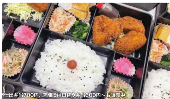
仕出弁当700円、店舗では日替り弁当600円〜も販売中

稲城市平尾2-8-7 ☎042-331-7580 🕒ランチ11:30~L.O.14:30、ディナー 17:00~L.O.21:30 📌5台 https://mezbaan.tokyo/