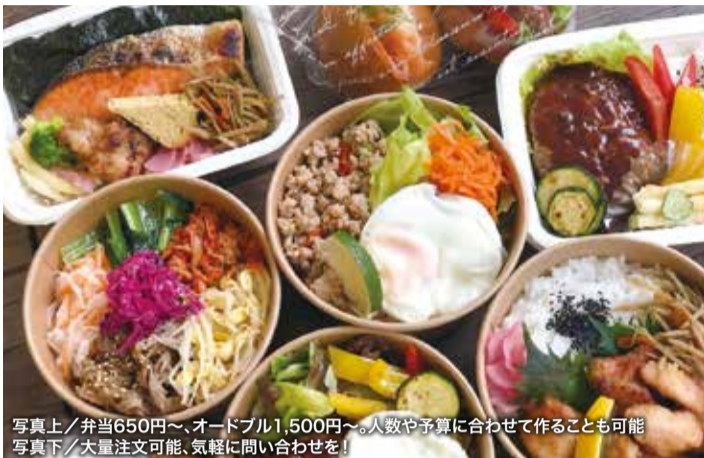
写真上/弁当650円〜、オードブル1,500円〜。人数や予算に合わせて作ることも可能 写真下/大量注文可能、気軽に問い合わせを!