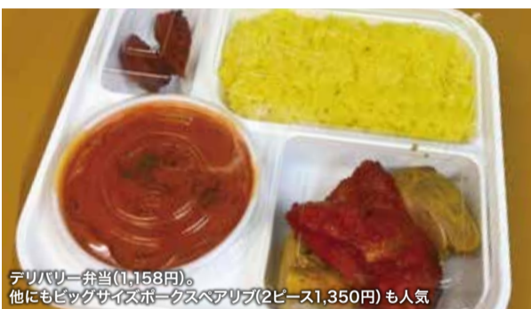
デリバリー弁当(1,158円)。 他にもビッグサイズボックスベアブリ(2ピース1,350円)も人気