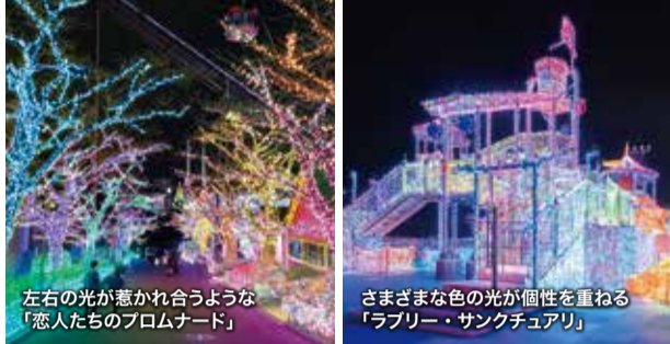
左右の光が惹かれ合うような「恋人たちのプロムナード」