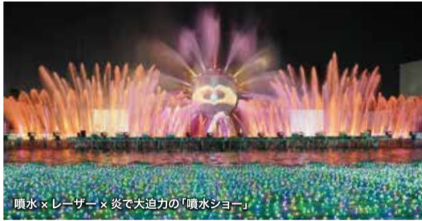
噴水×レーザー×炎で大迫力の「噴水ショー」