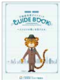
参加者には売買の流れが分かるガイドブックを進呈

今や土地や建物の売却は土地活用の選択肢の一つ。多くの不動産売買に関わった専門家から、得する売却・損する売却を学んでみませんか？不動産の売却について悩んでいる人は、この機会に参加を。不動産の価格査定相談にも無料で応じてくれます。