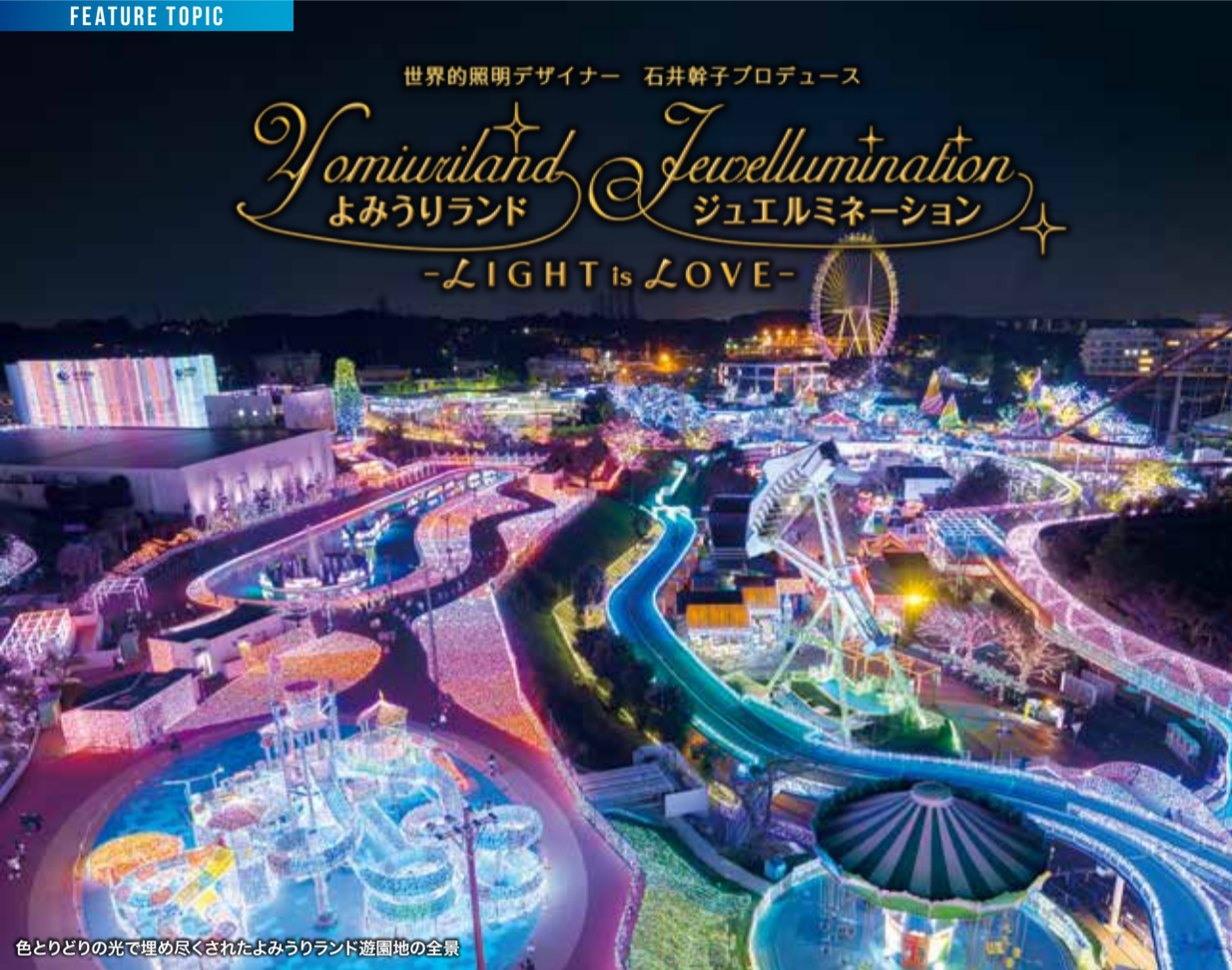
色とりどりの光で埋め尽くされたよみうりランド遊園地の全景