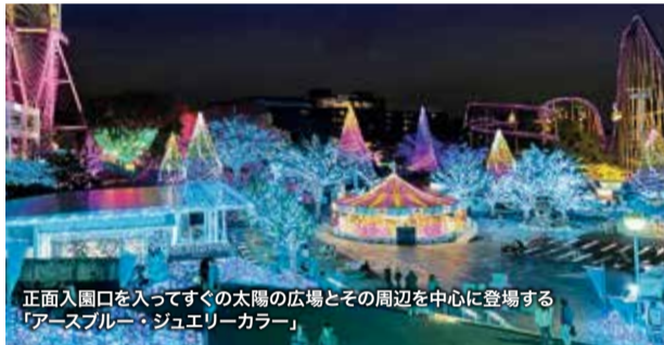
正面入園口に入ってすぐの太陽の広場とその周辺を中心に登場する「アースブルー・ジュエリーカラー」