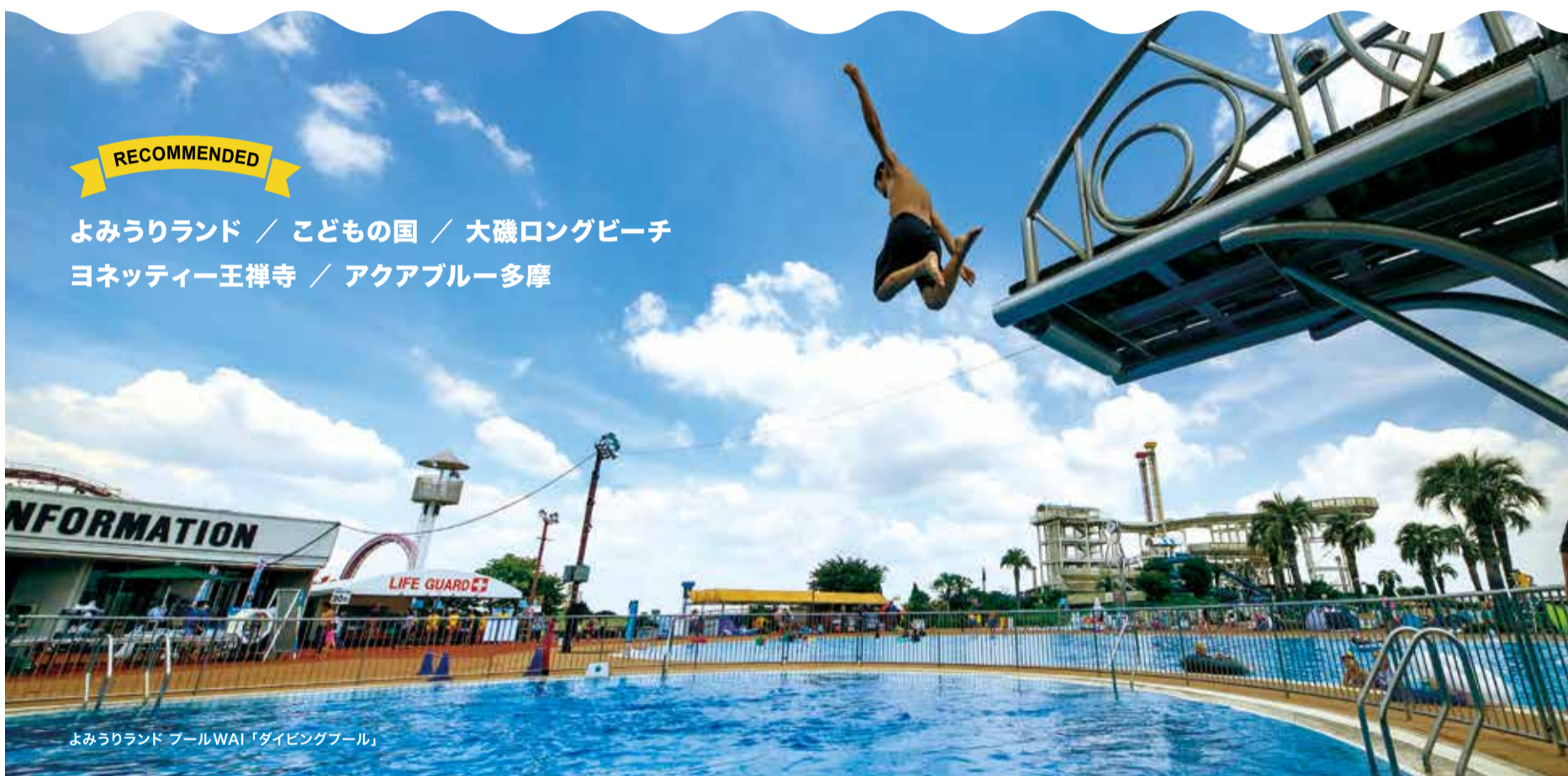
よみうりランド プールWAI「ダイビングプール」

よみうりランド / こどもの国 / 大磯ロングビーチ ヨネッティー王禅寺 / アクアブルー多摩