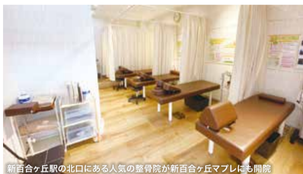
新百合ヶ丘駅の北口にある人気の整骨院が新百合ヶ丘マプレにも開院