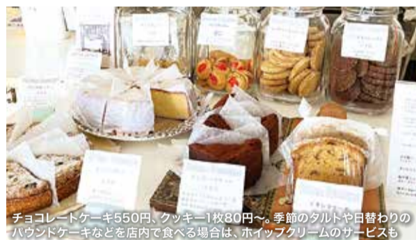
チョコレートケーキ550円、クッキー1枚80円〜。季節のタルトや日替わりのハウンドケーキなどを店内で食べる場合は、ホイップクリームのサービスも