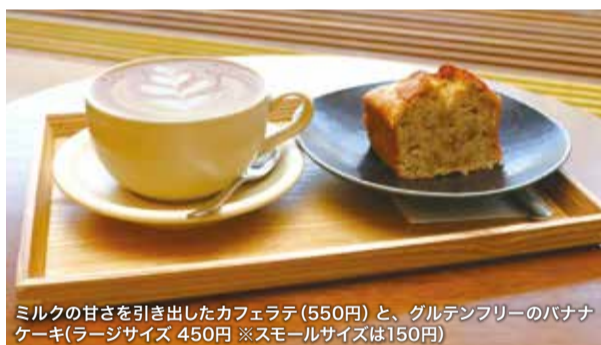
ミルクの甘さを引き出したカフェラテ(550円)と、グルテンフリーのバナナケーキ(ラージサイズ 450円 ※スモールサイズは150円)