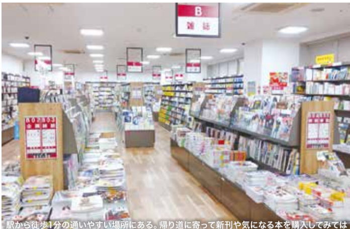
駅から徒歩1分の通いやすい場所にある。帰り道に寄って新刊や気になる本を購入してみれば