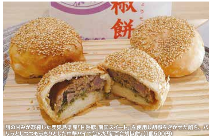
脂の甘みが凝縮した鹿児島県産「甘熟豚 南国スイーツ」を使用し胡椒をきかせた餡を、パリッとつつもっちりとした中華パイで包んだ「新百合胡椒餅」(1個500円)