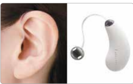
補聴器もここまで目立たなくなっている

百合ヶ丘に根を下ろし、「地元の家電屋さん」として親しまれているアメミヤ家庭電器。同店では毎月「補聴器の無料相談会」を開催している。当日は補聴器相談員による聴力測定や、聴こえに関わる悩みや相談事にも丁寧に。さらにバナソニックの最新充電式補聴器の試聴・装着体験も行う。次回開催日時は下記参照。自宅訪問も随時対応。