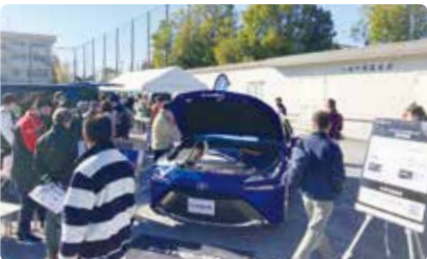
トヨタの水素発電車「MIRAI」の展示・実演も行われた

12月3日に山梨と紀伊地域で震度5弱、5日はトカラ列島地域で120回を超える地震が起こった。地震などの災害は事前の備えと地域・行政の連携が不可欠。4日には王禅寺中央小・中学校のグラウンドにて、麻生区総合防災訓練が行われた。ヘリコプターによる救助訓練や、トヨタの水素発電車の利用法紹介などもあり、有意義な訓練となった。