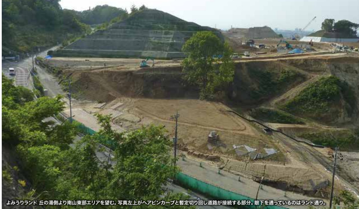
よみうりランド 丘の湯側より南山東部エリアを望む。写真左上がヘアピンカーブと暫定切り回し道路が接続する部分。眼下を通っているのはランド通り。