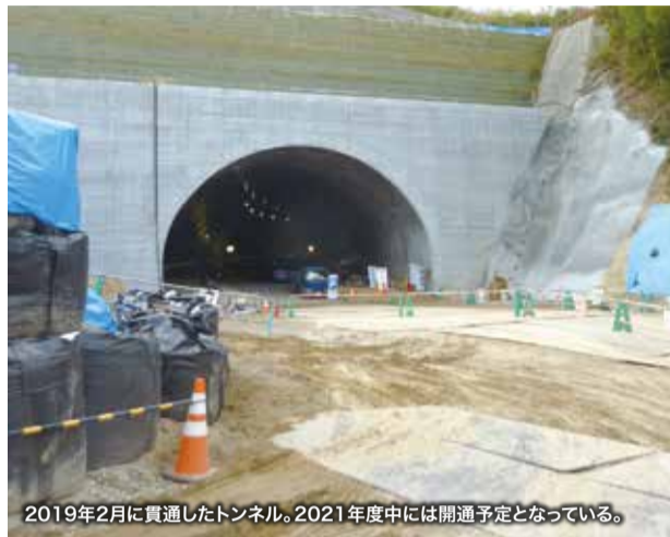
2019年2月に貫通したトンネル。2021年度中には開通予定となっている。